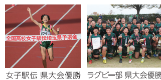
女子駅伝 県大会優勝