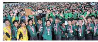
サッカー部 県大会優勝